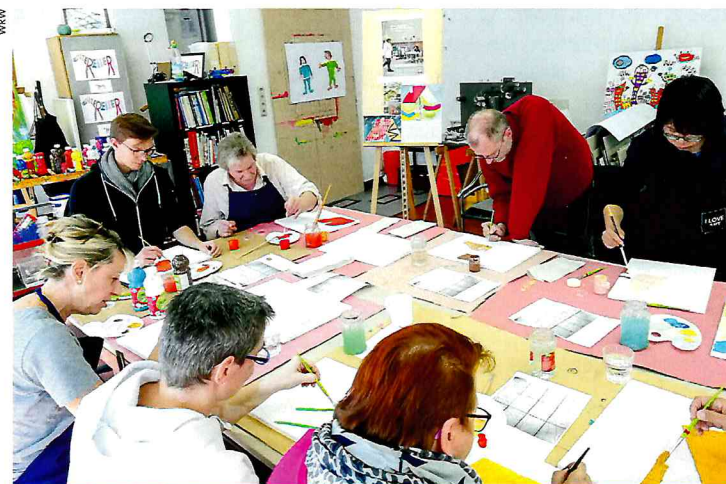
Zum Freizeitangebot der Werkgemeinschaft zählen auch die Kurse im Kunstatelier „Bunte Reiter“.

Einen Tag der offenen Tür gibt es beim Psychosozialen Zentrum in der Stettiner Straße 2 in Biebrich am 24. August – Flohmarkt inklusive. Am 5. September findet eine Fachtagung statt, am 10. Oktober ein Gala-Dinner im Westend und im Atelier Bunte Reiter werden hoffentlich 1.000 Origami-Kraniche ausgestellt werden, die auf den „Tag der seelischen Gesundheit“ aufmerksam machen sollen. Für diese Aktion kann man sich bereits ab Februar Origami-Bögen abholen (zehn Bögen für einen Euro, Anleitung inklusive). Der November bringt noch einmal eine Lesung, eine Malaktion und eine Fachtagung. Am 4. Dezember findet bei den „Bunten Reitern“ eine „Aktion Lichtermeer“ statt, und am 12. Dezember geht das Jubiläumsjahr mit der offiziellen 40-Jahr-Feier in der Alten Schmelze zu Ende. Weitere Informationen im Internet unter www.werkgemeinschaft-wiesbaden.de .